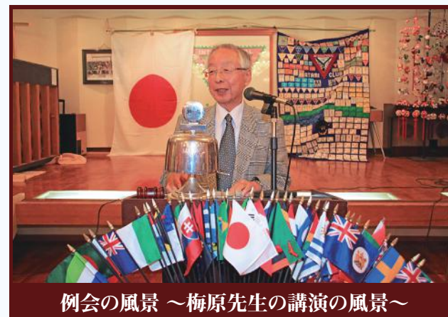
例会の風景 ～梅原先生の講演の風景～